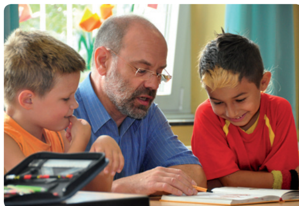
„Glückliche Kinder sind motivierter und wollen gerne lernen.“